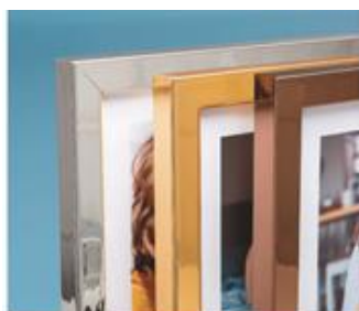
quadri e... tanto altro...